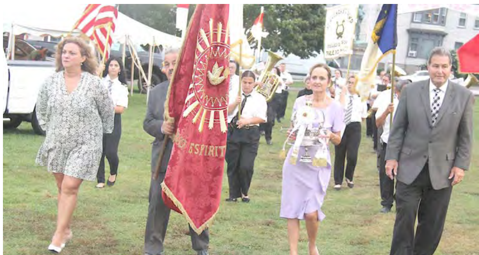
Vice-presidente das Grandes Festas do Espírito Santo da Nova Inglaterra