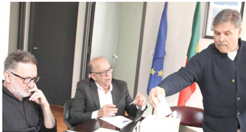
Um membro do Centro Cultural de Santa Maria em East Providence no momento em que votava para o Conselho das Comunidades.