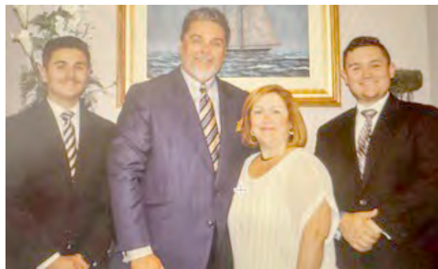
A família Lopes