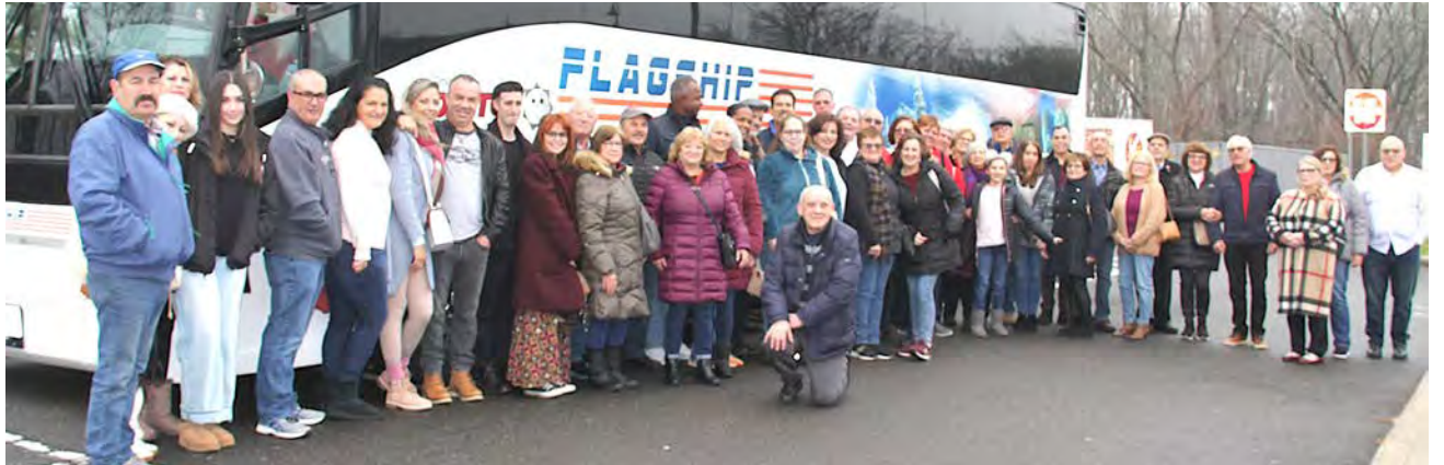
O numeroso grupo de excursionistas da Cardoso Travel a caminho de New York.

Sempre houve profissionalismo e o mais importante